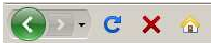
Icones del navegador Firefox Mozilla

Hi ha uns botons a la Barra de navegació que ens poden ser molt útils. Són una mica diferents segons el navegador que utilitzis, però generalment són aquests: